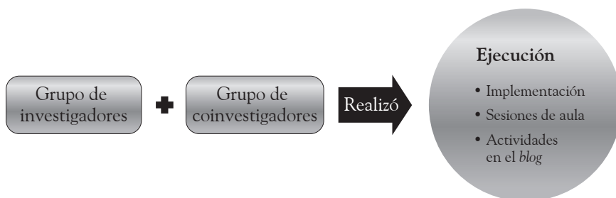
Figura 2. Representación gráfica de la fase II. Ejecución

Paralelo a lo anterior, como ya se mencionó, se diseñaron una serie de encuentros presenciales, que tenían como fin impartir las temáticas y los puntos exigidos en los ensayos, para así no caer en el error de exigir algo que no se había explicado. Cada sesión contó con una guía ruta que les permitiría a los coinvestigadores e investigadores tener claridad sobre el tema y el desarrollo de la clase; además, estas sesiones eran el punto de encuentro para comentar la estrategia y establecer acuerdos y reglas entre los participantes. Reglas que les permitieron a los investigadores realizar un mejor acompañamiento a cada uno de los colaboradores.