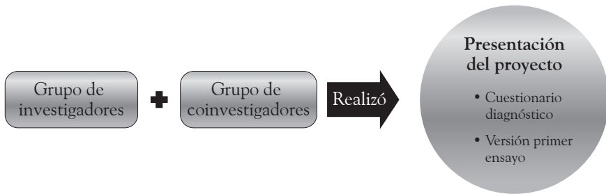
Figura 1. Representación gráfica de la fase I. Diagnóstico