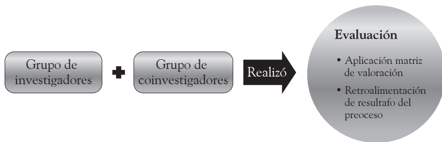
Figura 3. Representación gráfica de la fase III. Evaluación

se les solicitó a los coinvestigadores evaluar el proceso de esta mediante una matriz de valoración, la cual buscó medir de alguna manera cómo se sintieron frente a aspectos como: el uso del blog , el acompañamiento por parte de los investigadores-docentes, la cualificación de la escritura y el aporte de sus pares. Todo esto con el fin de reflexionar frente a la estrategia y poder identificar los aciertos y los desaciertos que se presentaron en su desarrollo.