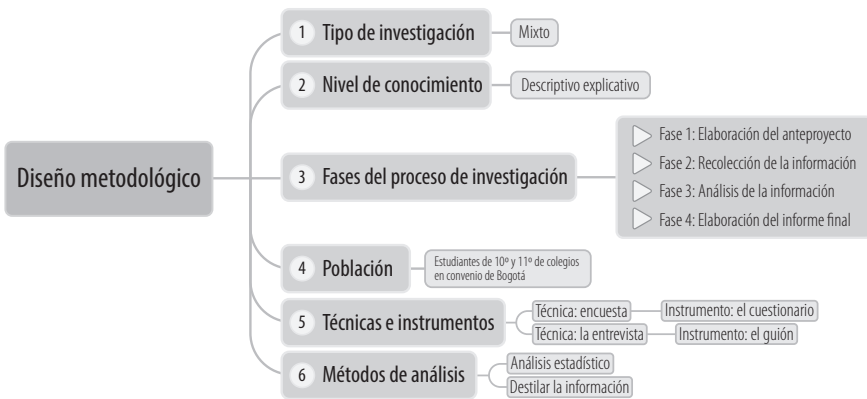
Figura 1. Diseño metodológico

El marco metodológico que fundamentó esta investigación proporciona al lector una contextualización acerca de la forma como se llevó a cabo la investigación, permitiendo una idea más clara del tema investigado. El presente apartado aborda los siguientes aspectos: el tipo de investigación propuesto, el nivel de conocimiento logrado, las fases desarrolladas, las técnicas e instrumentos con los que se recogió la información y, finalmente, los resultados y análisis obtenidos (figura 1).