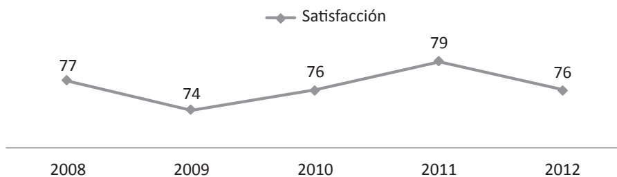
Figura 3. Satisfacción de estudiantes ingresantes con los servicios que presta la universidad, en el periodo académico 2008-2012

En la figura 3 se muestra el análisis de la satisfacción de ingresantes respecto a los servicios prestados por la universidad durante el periodo académico 2008-2012; así, se observa un desempeño irregular: si bien se mantiene en niveles aceptables (por encima del 70%), no se percibe una tendencia a la mejora, lo que repercute en la dimensión lealtad —permanencia estudiantil— y en el incremento del IDS.